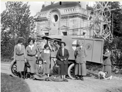
Les bénévoles américaines