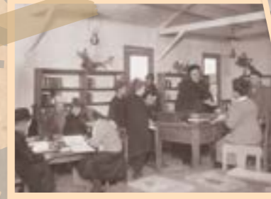
La bibliothèque de Coucy-le-Château, vers 1920