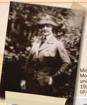
Miss Anne Morgan en uniforme, vers 1917