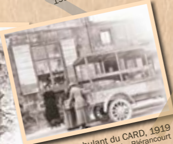
Magasin ambulant du CARD, 1919