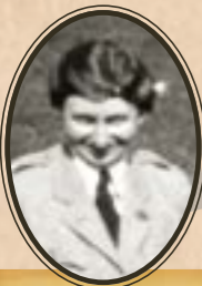
Marian Bartol © Musée Franco-Américain, Blérancourt