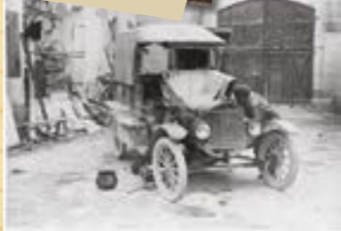
Une conductrice du CARD réparant sa Ford