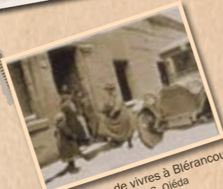
Distribution de vivres à Blérancourt, 1917