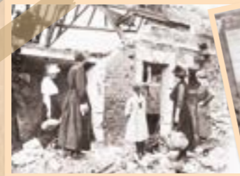
Une famille de réfugiés d'Anizy devant les ruines de leur maison, 1919