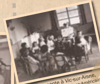
L'heure du conte à Vic-sur-Aisne, vers 1920