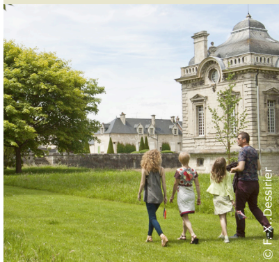
Le château de Blérancourt.

INFOS TOURISTIQUES : Office de Tourisme de Blérancourt Tél. 03 23 39 72 17