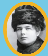
Marguerite Yourcenar 1903-1987