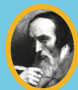
Jean Calvin 1509-1564

L'exposition Auteur/Lecteur est présentée à l'Université de Picardie Jules Verne et de manière éclatée dans les lieux participants, sous réserve de l'ouverture des lieux au public.