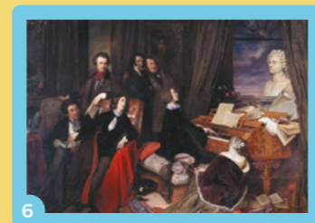
6 Visioconférence « Dumas et la génération des romantiques : une passion pour l'histoire », le 27 mars, animée par Sylvain Ledda.