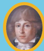
Louis Antoine de Saint-Just 1767-1794