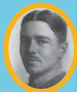
Wilfred Owen 1893-1918