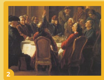
2 « Rousseau...Voltaire... D'Alembert... Condorcet face aux Lumières », le 2 avril, conversation animée par Isabelle Marsay.