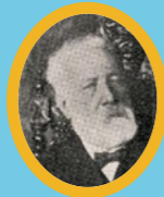
Jules Verne 1828-1905