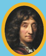
Jean de La Fontaine 1621-1695