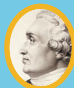
Nicolas de Condorcet 1743-1794