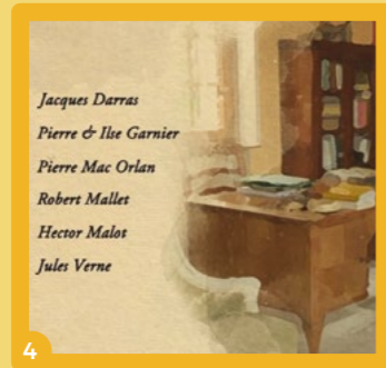
4 Présentation du web-doc « Ancrages-passages » Sept écrivains en Picardie, le 20 avril.