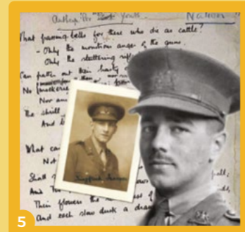
5 « La plume et le fusil », projection en ligne, suivie le lendemain d'une visioconférence avec la réalisatrice, Anne Mourgues, les 25 et 26 mars.