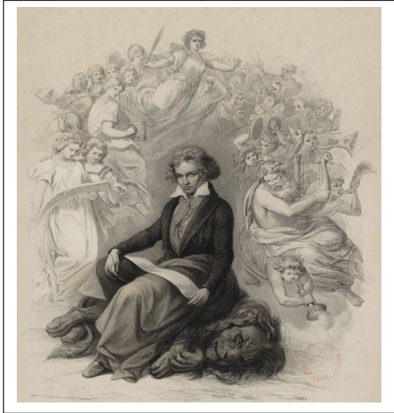
Ludwig van Beethoven, estampe d'après Joseph Charles Stieler, 1860. Gallica-BnF Beethoven terrassant le lion, symbole de la Monarchie.

Ludwig van Beethoven a dix-neuf ans lorsque la Révolution française éclate. Il s'enthousiasme par cet élan de liberté qui souffle en Europe, il quitte la coiffe et les bas de soie. En musique, Beethoven aussi veut bousculer les cadres et bien des idées fortes de la Révolution se retrouvent dans son œuvre - humanisme, liberté universelle, fraternité des peuples - «... Tous les hommes deviennent frères », extrait du poème l'Ode à la joie de Schiller sur lequel Beethoven construit l'impressionnant complexe musico-textuel du 4 ème mouvement de sa dernière symphonie.